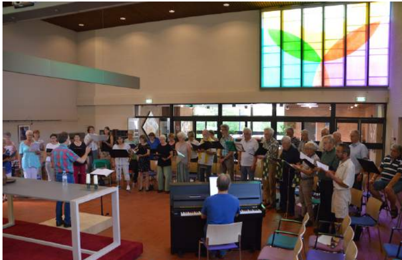
Lekker Samen Zingen in de Ontmoetingskerk, mei 2018

Want: niets zo heerlijk als samen zingen. Iedere zanger kent dat gevoel, gewoon nog eens lekker een al min of meer bekend nummer willen zingen. Onbekommerd, geen lange repetitie periode, geen concert, gewoon genieten van het moment zelf. Daarom organiseert het projectkoor wederom een zeer kortdurend project - 1 dagdeel - onder de titel